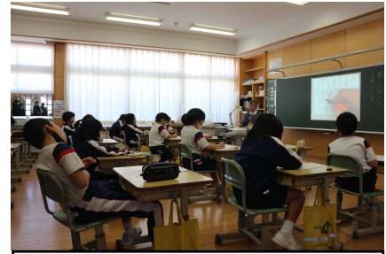
3-1:カンジエ博士の音訓かるた