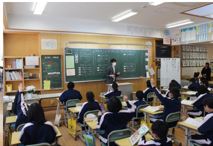
4年:ぼくの生まれた日