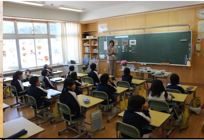
2年:大きくなった自分を振り返ろう