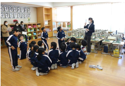
3-2:カンジエ博士の音訓かるた