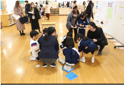
1年:昔から伝わる遊びを楽しもう