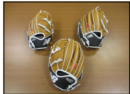
大谷選手から届いたグローブ