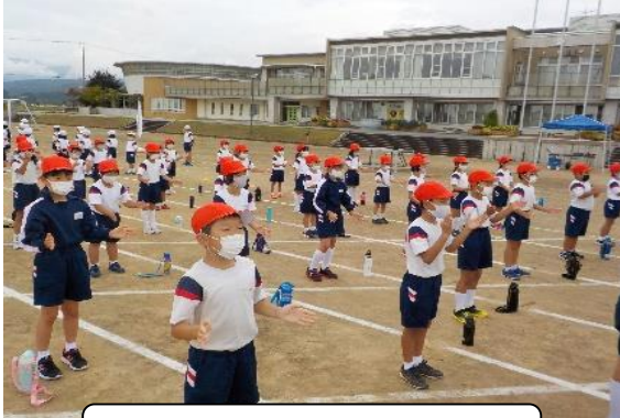
赤白に分かれて応援練習