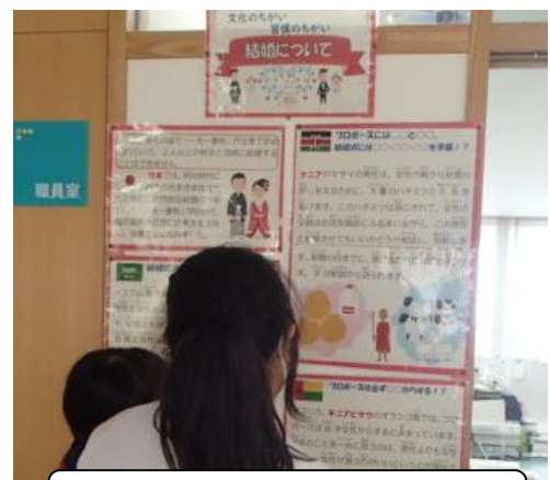
国際理解コーナーの掲示