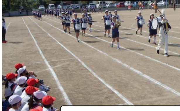
鼓笛隊パレードのリハーサル