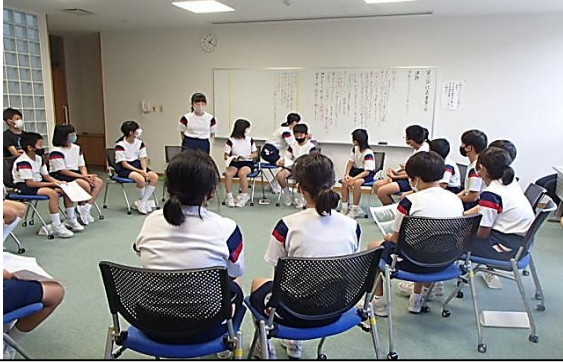
スローガンについて話し合った代表委員会