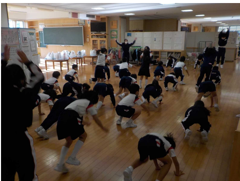
朝の体操 普及活動

また、教室前の広いフリースペースを利用し、他学年と一緒に学習することも例年通り続けています。左の写真は12月1日(火)に行われた1、2学年の合同学習会の様子です。2年生は生活科「どきどき わくわく まちたんけん」で調べてきた宇奈月温泉街のお店や施設、下立の全龍寺などについてグループ毎に新聞をつくり、クイズを交えて発表しました。1年生は真剣に2年生の発表を聞いたり、楽しくクイズに答えたりするなど、宇奈月のことについて知ると同時に、早く2年生になって町探検に行きたい、自分たちも来年の1年生に教えてあげたいという気持ちが大きくふくらんでいました。ご協力いただいたお店や施設の方々本当にありがとうございました。