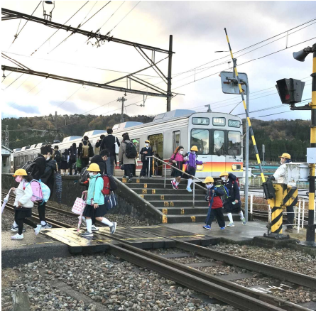
朝の浦山駅の様子

宇奈月温泉駅からの通学だけでなく、下立、栃屋地区の子供たちも12月1日(火)から冬期の電車通学を始めました。