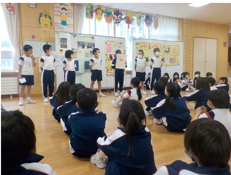
2年生 生活科の発表

しかし、どの学年も工夫を凝らし、できる範囲で音楽の時間に発表会を行っています。練習時からランチルームを使用し、距離をとりながら演奏したり、鍵盤ハーモニカやリコーダーの演奏では、机の消毒を行ったりするなど、例年のない注意は必要ですが、できる限りの配慮をし、豊かな学習となるように工夫しています。