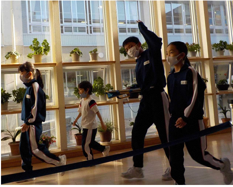
縦割り班でオリエンテーリング

児童会の集会委員会が考えたお楽しみ集会を実施しました。例年であればランチルームや休み時間を利用して自然に縦割りの活動ができていましたが、現在は休み時間をずらしていたり、ランチルームの利用を2つの学年に絞ったりしているため、一緒に活動する機会が少なくなっています。どの学年の人たちとも仲良くしてほしい、そのような願いを込めて内容が計画されました。