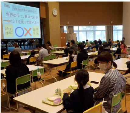
ランチルームでの親子給食

食べていましたが、この日だけは親子で椅子を並べ、笑顔で和やかに食事をとることができました。ランチルームに親子の温かな密の時間が広がっていました。