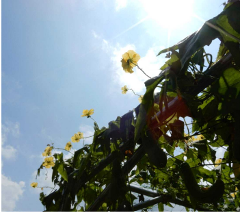
青空に向かって咲くヘチマ

ビオトープ近くの畑で、大きな実を付けたヘチマのおばなが夏を惜しむかのように、青空に向かって小さな花を咲かせています。