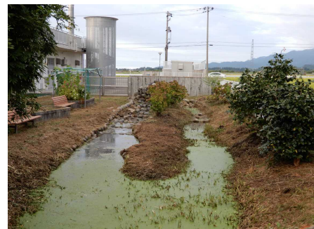
さっぱりしたビオトープ