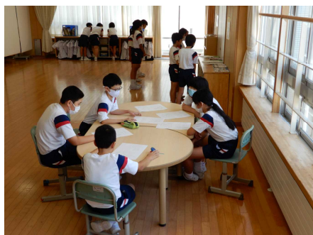
6年生の休み時間の話合いや練習

1年生は行進や徒競走のスタート練習を校舎日陰を使って水分補給をしながら行っています。また、グラウンドで実際にタイム測定をすると、自然に走っている友達に「がんばれーっ!」と声が出ます。