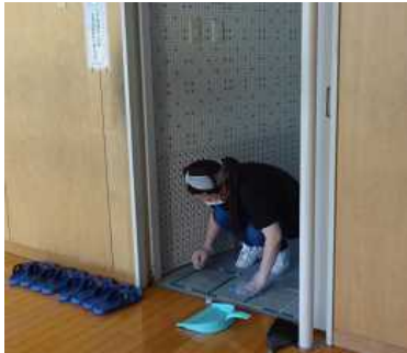
スリッパラインを新しく

8月30日(日)の早朝から、学校美化活動をPTA行事として行いました。7時スタートとはいいつつも、到着された方々が早い時間から