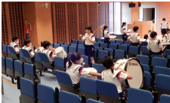
多目的ホールでの鼓笛隊練習

今年の運動会は競技に対する熱い思いだけでなく、困難に負けず最もよい方法を探し出そうとする粘り強く取り組んだ成果も見られるのではないかと期待しています。