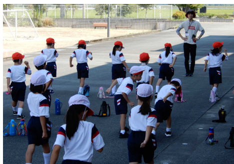
1年生のスタート練習

運動会当日もテント内の団席からマスクを付けて応援する声が自然に盛り上がっていくことも十分に予想されます。テント内の間隔に気を付けつつ、応援の在り方について子供たちの素直な気持ちを大切にしながら準備を進めていきたいと考えています。