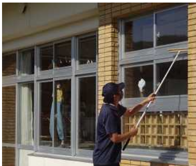
外の高窓をワイパーで

除草に取りかかり、刈払い機のエンジン音が敷地内のあちこちから聞こえてきました。また、子供たちだけではなかなかできない高窓や床の隅々まで、本当にきれいになりました。一面セリとヨシで覆われていたビオトープも大部分の植物を取り除き、ようやく形が分かり手入れできるようになりました。きれいにしていただいた所を気にとめながら、感謝して過ごしたいと思います。暑い中の作業、本当にお疲れ様でした。