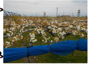
新興果樹園梨の花が満開