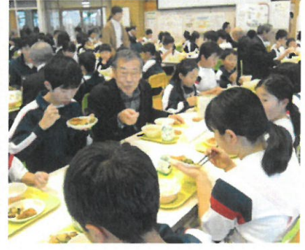
「感謝して食べようね」