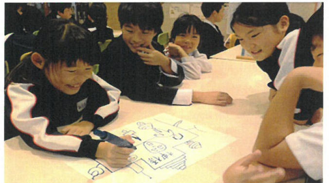
全校集会（心をつなごう集会）