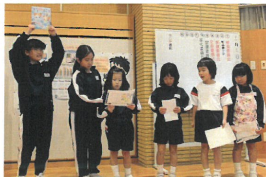
「私のおすすめの本は・・・です」

家庭では、親子読書にも取り組んでいただき、家族の会話も増えたことと思います。「読書は心の栄養」とも言います。これまで以上に、読書に親しんでいただければ幸いです。