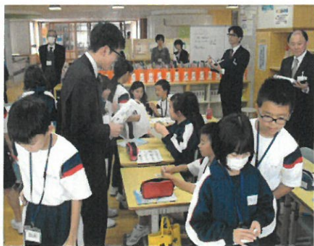
4年 「Do you have a pen?」