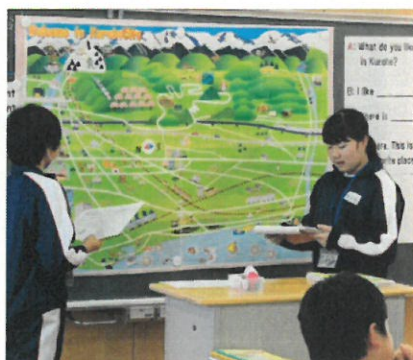
6年 「I like my town」