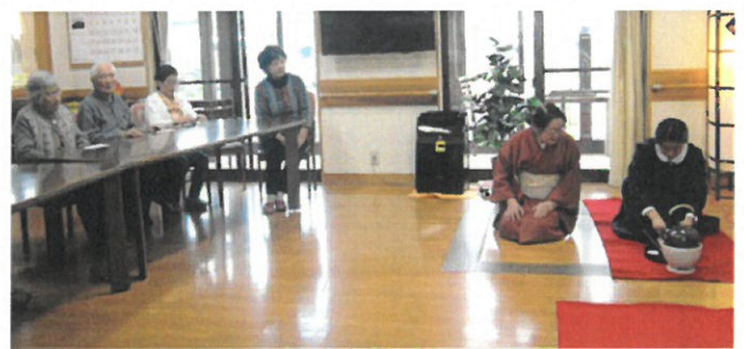
茶道クラブ あいの風訪問