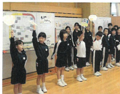
各学年の挨拶運動の取組発表

また、11月は全校で挨拶運動に熱心に取り組みました。「毎朝の挨拶が暗い、挨拶しない人もいる」という子供の訴えから、各クラスで自分たちにできる挨拶運動を考え、実践しました。うちわを振って挨拶を盛り上げる1年生。「〇〇さんおはよう」と相手を意識した2年生。毎日一人15人を目標にした3年生。たすきをかけたの校内巡りや各階のフロアで挨拶をする4年生。各教室前でみんなを迎える5年生。「すてきな挨拶チャンピオン探し」や音楽を使った挨拶で、玄関を明るくする6年生。各学年のアイデアを生かした挨拶運動の取組を通して、学校中が朝から活気にあふれました。