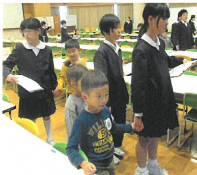
「こっちに並んでね」

11月13日（水）、来年度入学予定児29名の「就学時健康診断」を実施しました。5年生が園児と手をつないで付き添い、健康診断会場を順に回りました。5年生にとっては、園児一人一人に優しい声をかけお世話することを通して、最高学年になる自覚を高めるよい経験になりました。来年度のかわいい1年生の入学を全校で楽しみに待ちたいと思います。