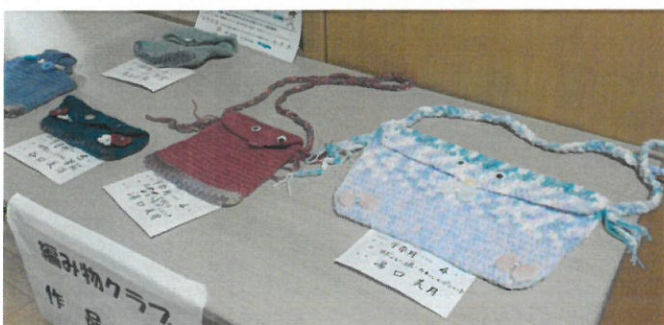
編み物クラブ 作品展示