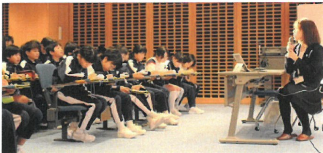
6年 総合 「赤い羽根共同募金出前講座」