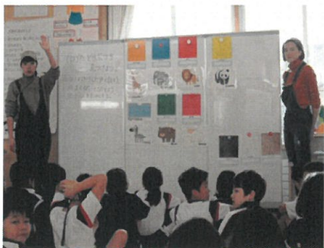
2年 「どうぶつ園に行こう」

今年度の11月は黒部国際化教育推進事業の一環として、市内全小中学校で英会話科の授業公開を実施しました。本校では11月18日（月）、21日（木）、22日（金）の3日間にわたり、全学級で授業を公開しました。保護者や地域関係者の外、県・市教委からも多数ご参加いただきました。