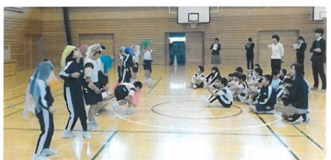
3年 学級活動 「スマイルタイム」