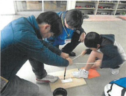
3年1組 学級活動「火育」