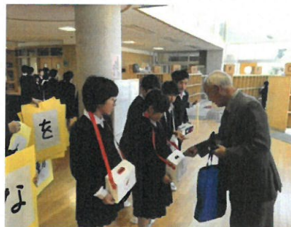
フリー参観時の募金活動

6年生は、台風19号や大雨に関する被害についての新聞学習に取り組みました。新聞から被害の大きさを理解し、自然の恐ろしさや被害に遭われた方々の悲しみ、大変さを痛感しました。そして、「自分たちに今、何かできることはないか」と、募金活動に取り組みました。ランチルームや各教室を回り募金を呼びかけたり、フリー参観を利用して保護者の皆様にも募金の協力をお願いしたりしました。今できることを現実的に考えて、それに自分たちの思いや願いを込めて取り組んでいる姿は、多くの人々の心に響き、ボランティアの輪がどんどん広がっていきました。