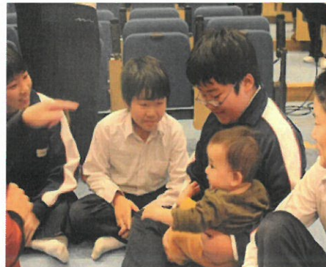
6年 総合「いのちの授業」