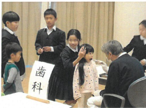
「頭をそっと押さえているからね」