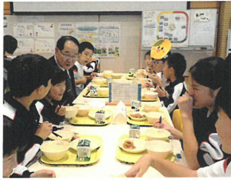
楽しい会話が弾む会食