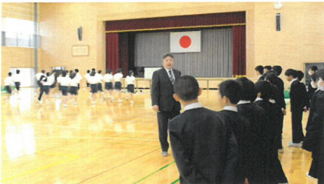
6年 桜井中学校見学会