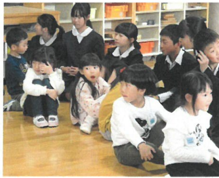
「困ったことはないかな」