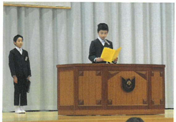
始業式で新年の誓いを述べる子供たち

2019年のスタートにあたり、宇奈月小の子供たちにも今年一年間の目標（夢）を決めて、その実現に向けてしっかりと計画を立ててほしいと思います。何事に対しても真面目に取り組み、希望に満ちた明るい将来を自分の努力によって手に入れてほしいと思います。「努力に勝る天才なし」という言葉もあります。毎日の小さな努力がやがて大きな成果をもたらしてくれることを信じて、今年一年、仲間と共に様々なことを学び続け、笑顔を忘れず、元気よく、夢のある楽しい学校生活を過ごしましょう。今年も宇奈月小学校の皆さんの前途に幸多きことを祈っています。