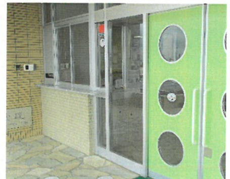
インターフォンで事務室へ連絡を

学校を取り巻く様々な事件や事故等への対応のために、1月よりこれまで以上に校舎の出入口の施錠に努めることにしました。一般玄関は常時施錠することとし、ご来校の際はインターフォンをご利用いただくとともに、お名前やご用件等の確認にもご協力をお願いします。児童玄関は体育の時間をはじめ、大休憩や昼休みのグラウンド使用時には解錠しますが、必要のないときはできるだけ施錠した状態を保つようにします。通院や家事等で遅れて登校される場合は、一般玄関のインターフォンにてその旨をお伝えください。ご不便をおかけしますが、子供たちの安全・安心を守るために、ご協力をお願いします。また、これまででも交通安全の面でお伝えしておりますように、お子さんを自家用車で送迎される場合は、緊急時以外は県道側の駐車場をご利用くださるよう重ねてお願いします。