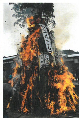
勢いよく燃え上がる炎