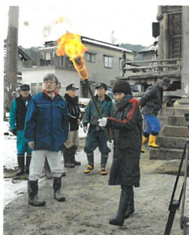
神聖な雰囲気の中で