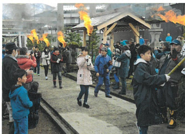
ご神火を携えて入場する6年生